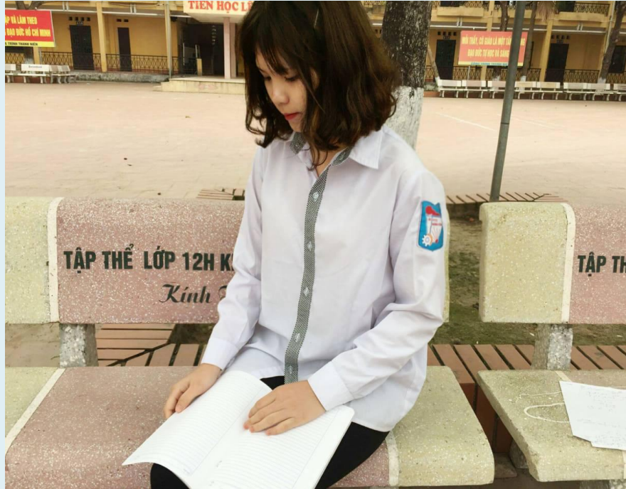
Áo sơ mi của nữ

+ Áo khoác mùa đông: màu hi vọng xanh lá lại là tông màu chính, đặc biệt nó được thiết kế tinh xảo với những viền kẻ trắng ,cùng những lớp bông dày chiếc áo là lựa chọn tối ưu của học sinh những ngày đông giá rét