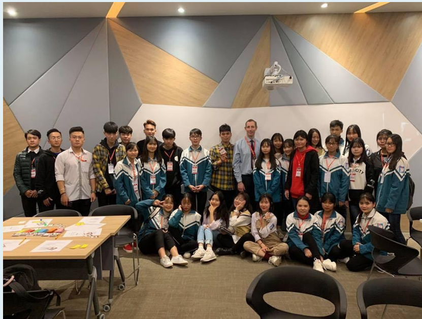
Trải nghiệm tại trường đại học BUV

-Chuyến đi thực tế tại trường Đại học BUV- Đại học FPT, là những chuyến đi trải nghiệm đầy mới mẻ về chương trình học, giúp học sinh được giao lưu gần hơn với những phương pháp học phát triển, đồng thời định hướng nghề nghiệp của các bạn