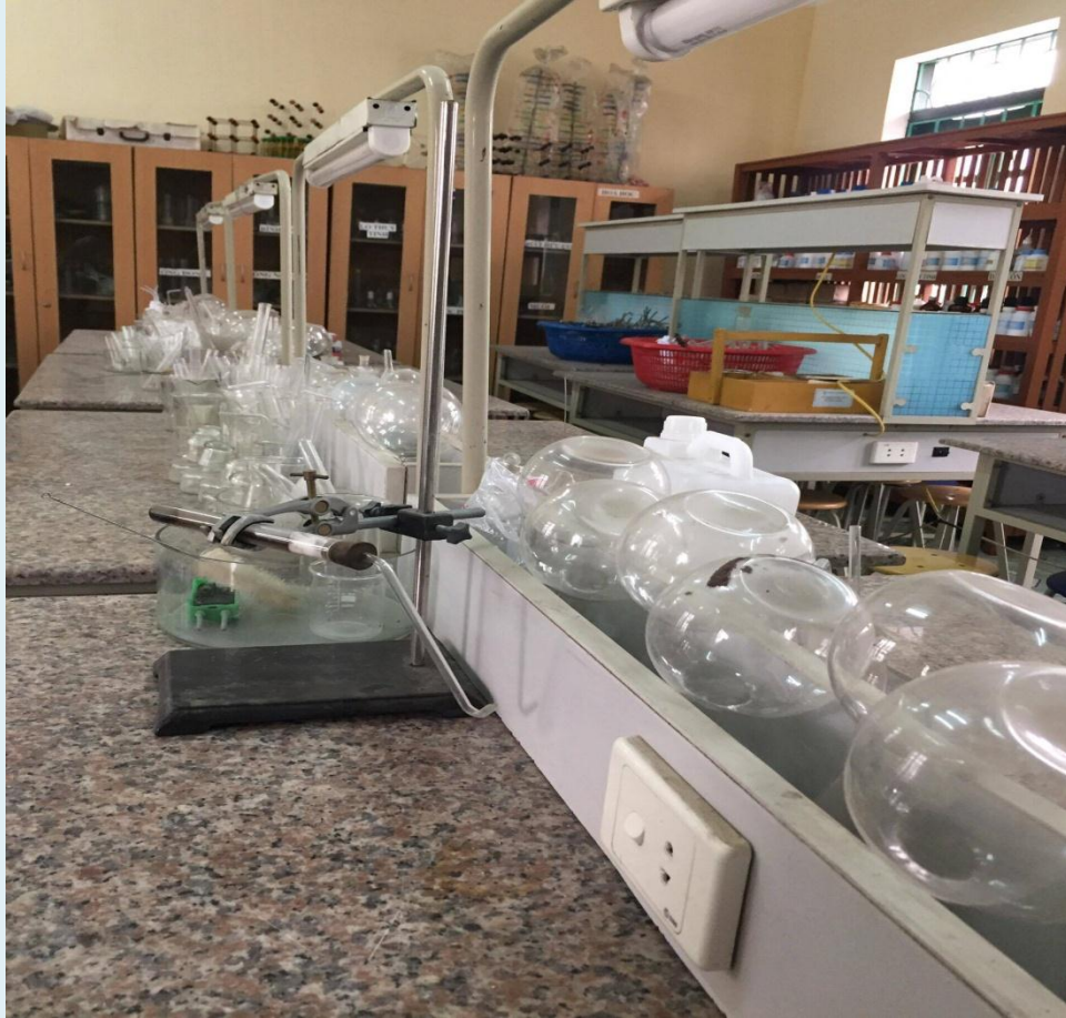
Bộ dụng cụ thực nghiệm được sắp xếp gọn gàng