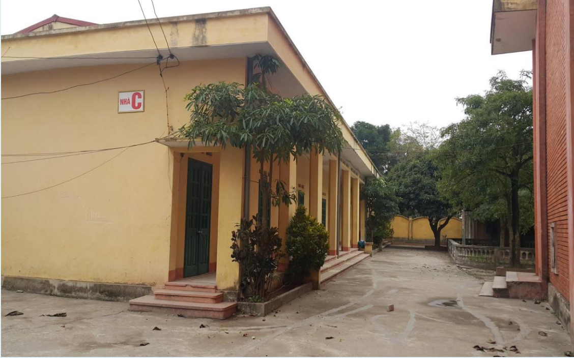
Khu nhà C dành cho học sinh khối 10