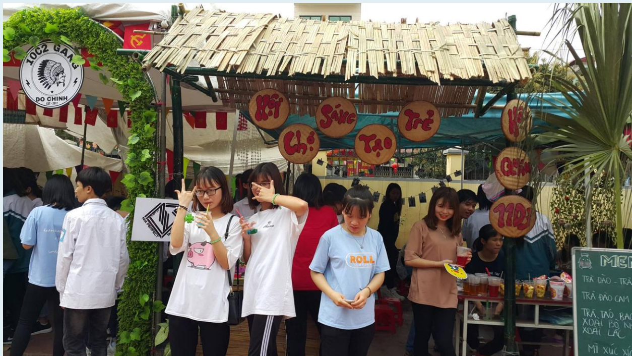
Sự nhộn nhịp của các bạn học sinh tại ngày hội sáng tạo trẻ.