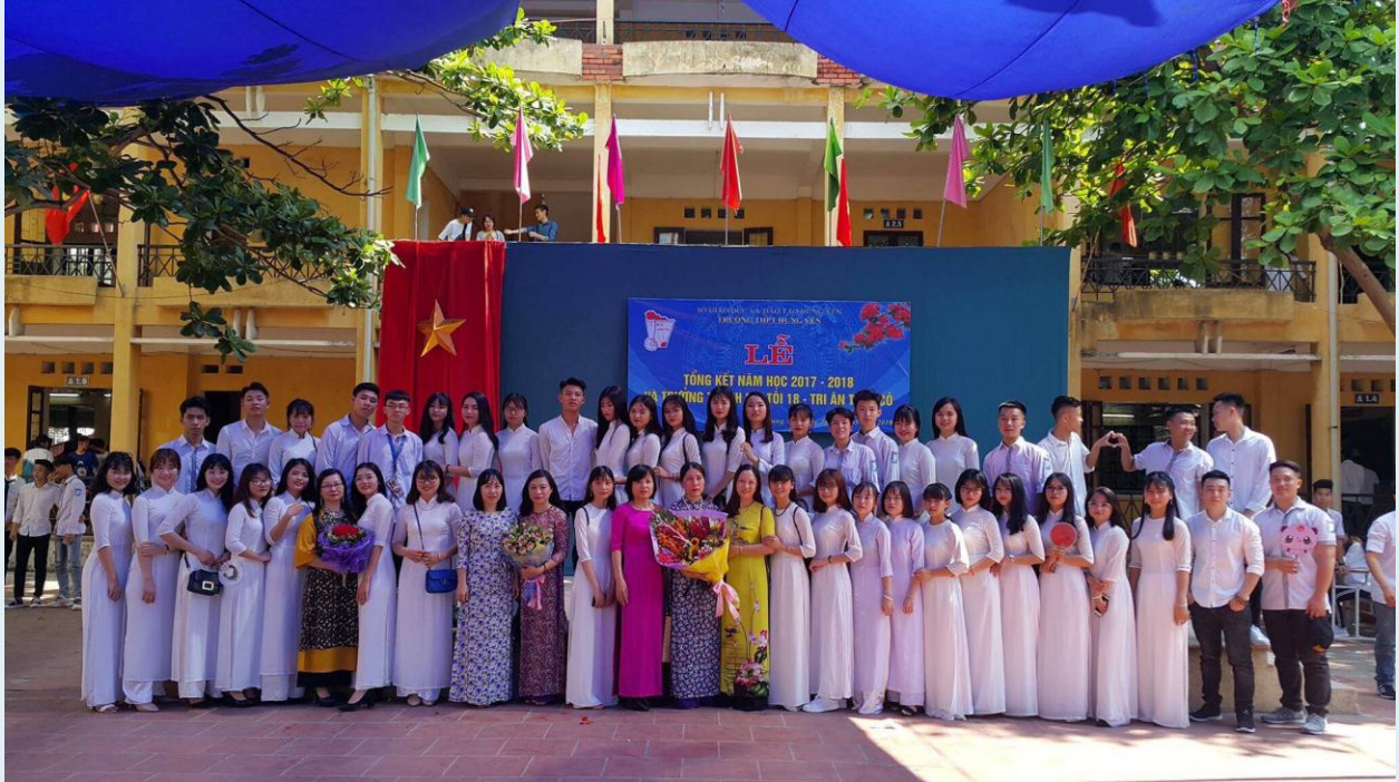
Lớp 12 D3 khóa học sinh 2015-2018