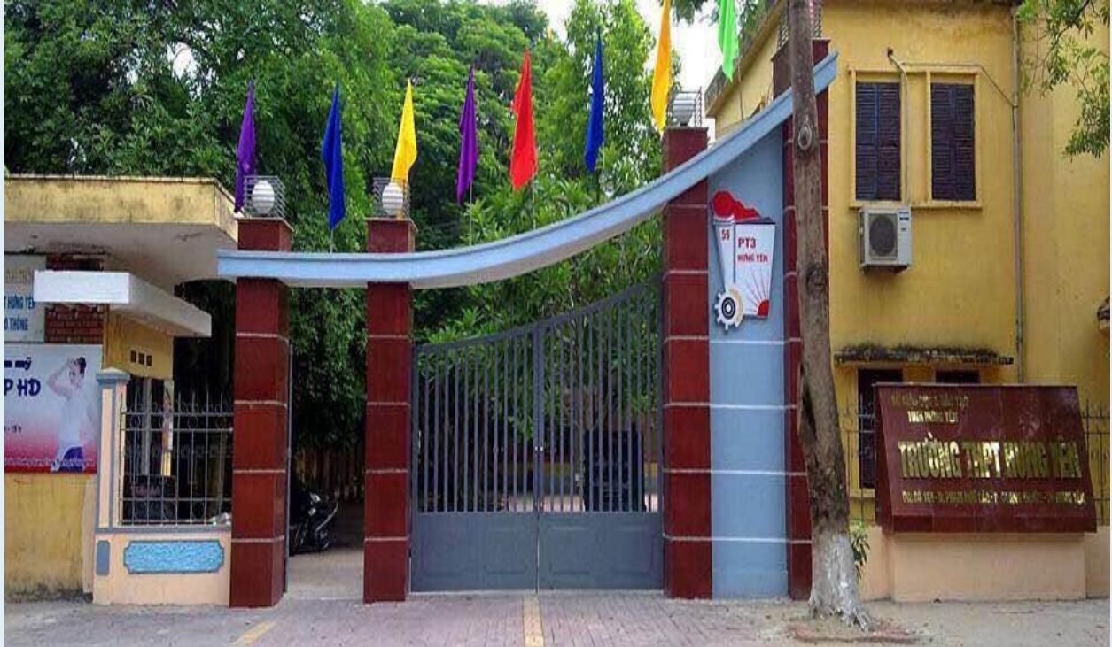
ẢNH CÔNG TRƯỜNG LẦN 2 SAU KHI XÂY DỰNG

Quãng thời gian ba năm gấn bó, chẳng thấm đâu với những trang sử dựng xây ngôi trường này. Nhưng đủ để những trái tim nơi đây dành trọn niềm tin và tình yêu cho nó.