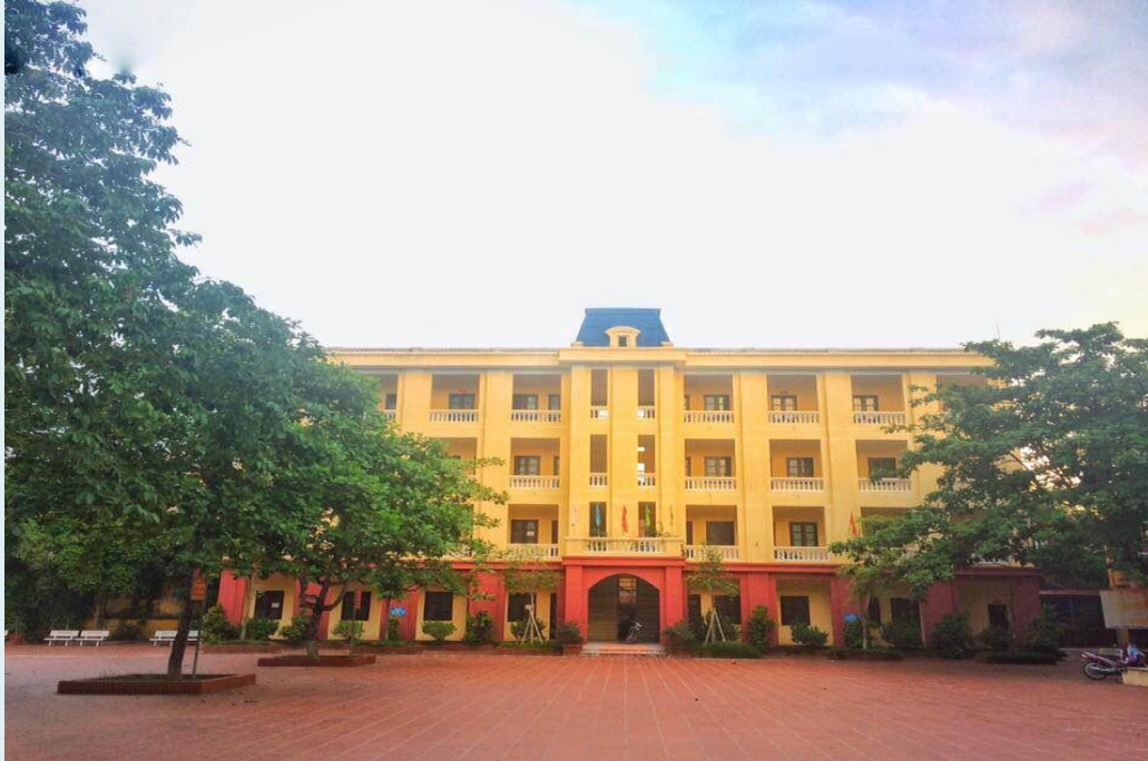
+Hai khu nhà học ba tầng.