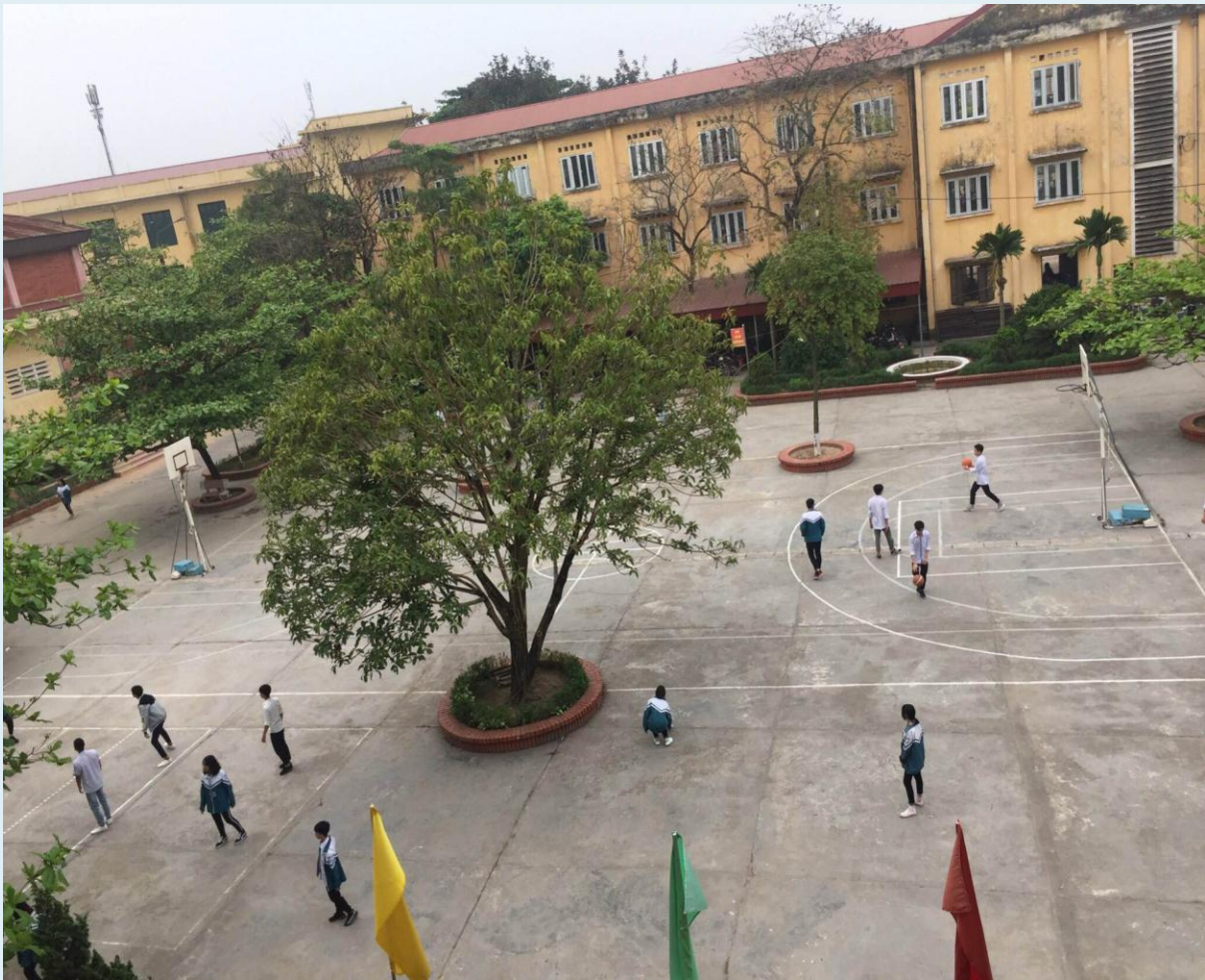
Giờ ra chơi sau mỗi tiết học căng thẳng học sinh thỏa thích hoạt động vui chơi

Ngôi trường Trung học phổ thông Hưng Yên dấu yêu.Yêu dãy ghế đá trước phòng học với hàng cây thẳng tắp dịu mát êm đềm.Yêu góc nhỏ ở sân sau tòa nhà lúc nào cũng đông đúc.Ấn tượng với cảnh sân trường vào mỗi giờ ra chơi, mỗi buổi xế chiều lúc các câu lạc bộ sinh hoạt nhóm vui vẻ, nhộn nhịp.