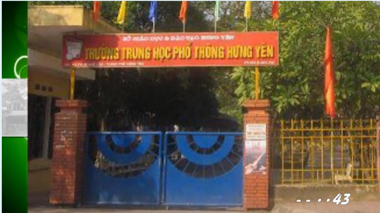
Ảnh cổng trường xây dựng lần đầu đơn giản với màu chủ đạo là màu xanh dương