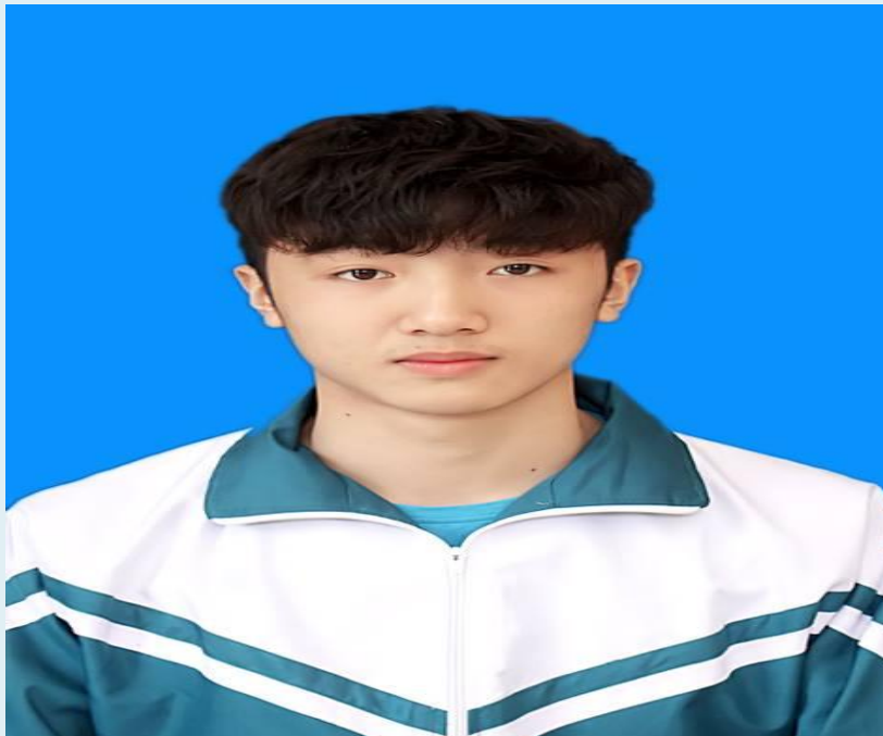
Áo khoác mùa đông

+ Áo khoác mùa đông: màu hi vọng xanh lá lại là tông màu chính, đặc biệt nó được thiết kế tinh xảo với những viền kẻ trắng ,cùng những lớp bông dày chiếc áo là lựa chọn tối ưu của học sinh những ngày đông giá rét