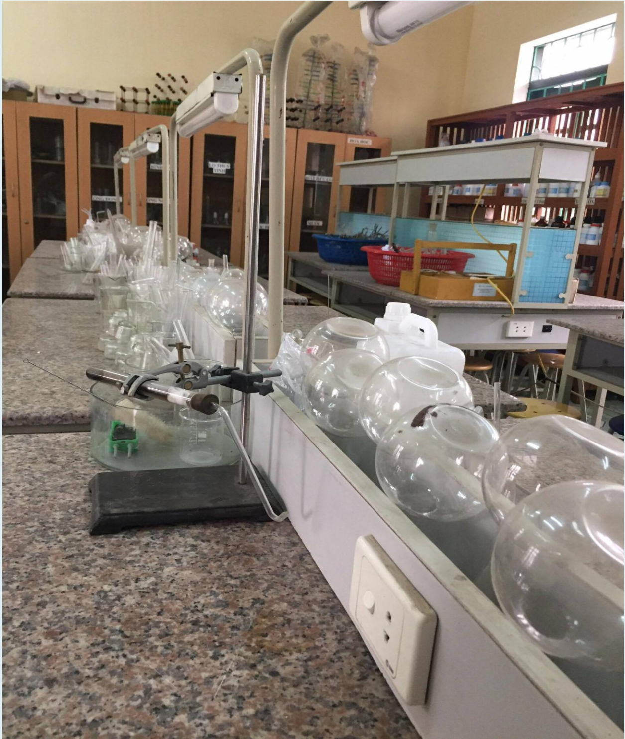
Phòng hóa học với đầy đủ dụng cụ thí nghiệm