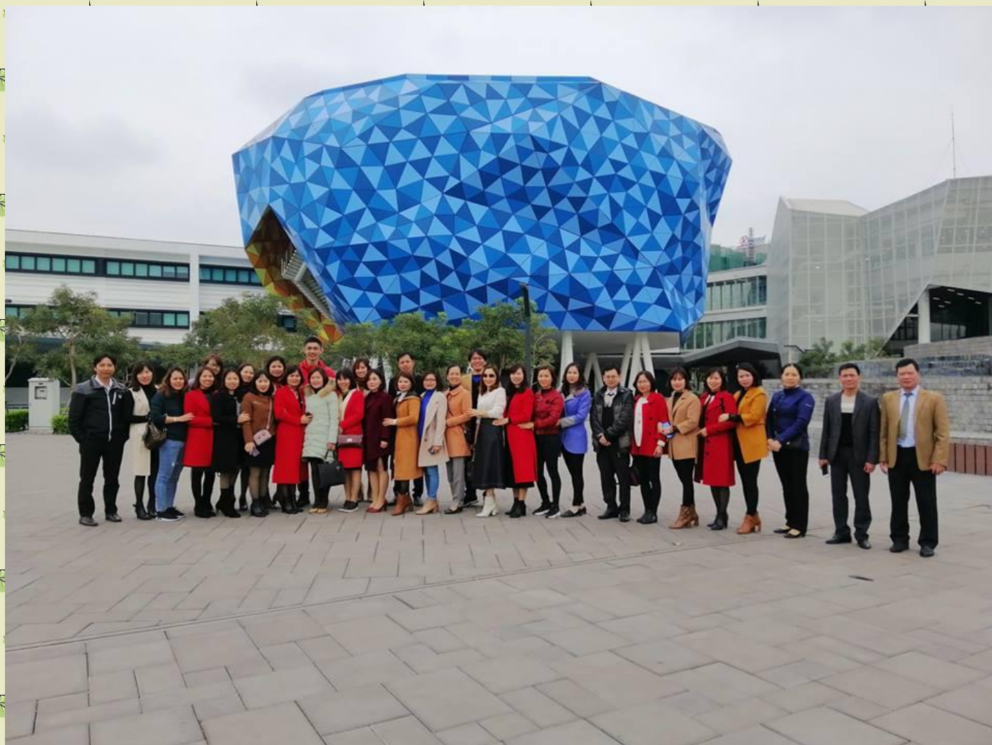
Đội ngũ giáo viên của nhà trường tham gia Ngày hội trải nghiệm tại Trường ĐH Anh Quốc BUV năm 2019

Phát huy truyền thống hiếu học của nhà trường trong 60 năm qua, trường THPT Hưng Yên đã chứng tỏ nơi đây thực sự là cái nôi ươm mầm những tài năng khoa học cho quê hương đất nước. Mỗi năm học qua đi, đều đánh dấu sự trưởng thành vững vàng của nhà trường, về quy mô trường lớp, nhà trường hiện có 33 lớp với trên 1.300 học sinh phân bố ở hầu hết các phường, xã của thành phố Hưng Yên. Học sinh nhà trường có truyền thống chăm ngoan, hiếu học. Các em không những luôn hoàn thành tốt mọi nhiệm vụ học tập, tham gia tích cực các hoạt động đoàn thể, các phong trào thi đua ở trong nhà trường mà còn hăng hái, nhiệt tình, hoàn thành xuất sắc các nhiệm vụ chính trị mà địa phương giao cho nhà trường như: tham gia các màn đồng diễn nhân dịp kỉ niệm thành lập tỉnh Hưng Yên, tham gia giải việt dã Báo Hưng Yên, tham gia Đại hội thể dục thể thao của tỉnh và