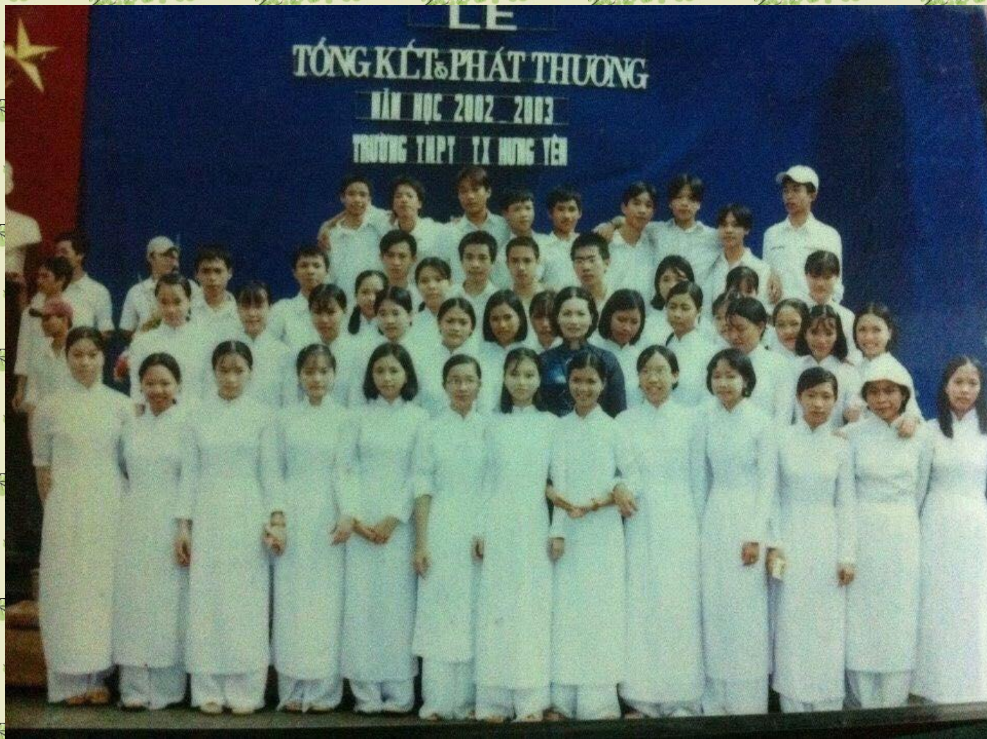
Một Chi Đoàn của nhà trường trong Lễ Tổng kết - Khen thưởng năm học 2002-2003