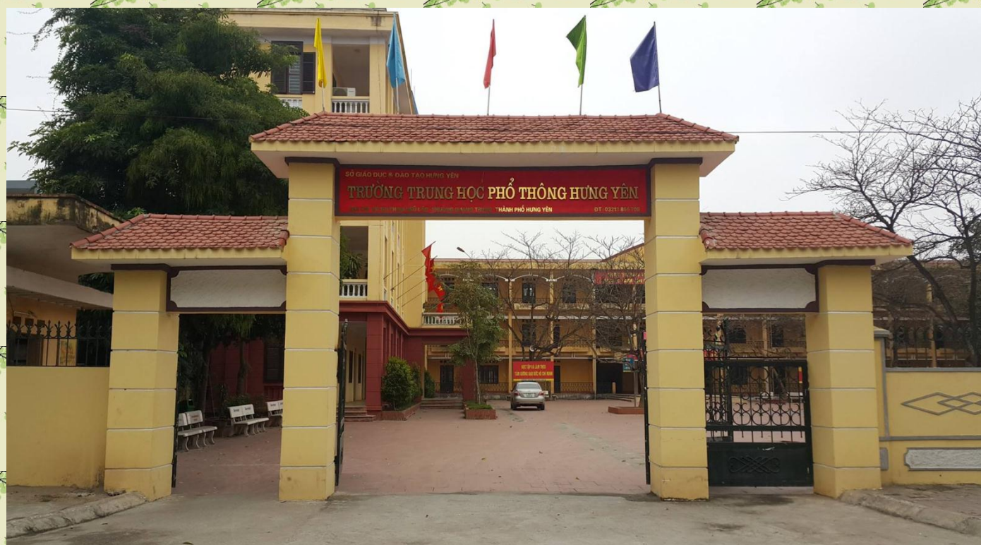
Trường THPT Hưng Yên – số 168 Phạm Ngũ Lão

Trong lịch sử phát triển của Ngành Giáo dục Đào tạo tỉnh Hưng Yên, trường THPT Hưng Yên là ngôi trường được thành lập sớm nhất, được xây dựng trên mảnh đất “địa linh nhân kiệt”, nơi có truyền thống Văn hiến hiếu học, từ đó nhà trường có điều kiện giáo dục các thế hệ học sinh kế thừa và phát huy truyền thống của cha ông. Nhà trường được thành lập vào tháng 9/1959 theo Quyết định của UBND tỉnh Hưng Yên và được đặt tại khu vực Chợ Gạo. Với tên gọi trường cấp III Hưng Yên, khi mới thành lập, trường chỉ có hai mái nhà tranh vách đất với 5 lớp học, trong đó có 4 lớp 8 tuyển sinh mới và 1 lớp 9 gồm học sinh là con em Hưng Yên đang học ở Hải Dương và Thái Bình chuyển về. Qua 5 lần thay đổi vị trí, từ năm 1994 - đến nay trường tọa lạc tại 168 - đường Phạm Ngũ Lão - phường Quang Trung - TP. Hưng Yên.