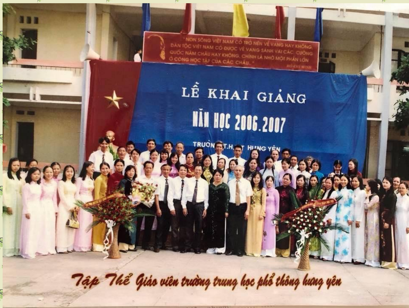
Tập thể Giáo viên trường THPT Hưng Yên trong lễ khai giảng năm học mới 2006-2007